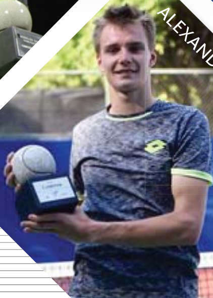
ALEXANDER BUBLIK (2017)