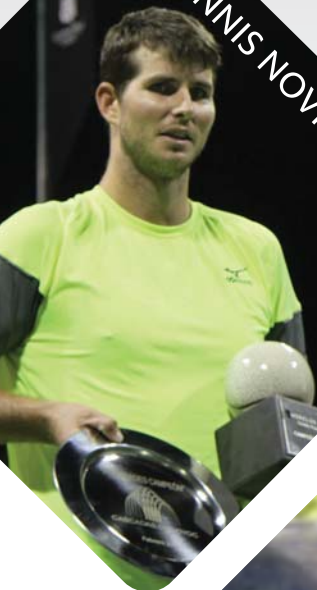
DENNIS NOVIKOV (2018)